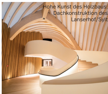
Hohe Kunst des Holzbaus: Dachkonstruktion des Lanserhof, Sylt