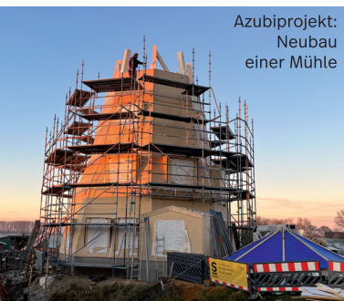
Azubiprojekt: Neubau einer Mühle

Am Ende der Ausbildung steht die Gesellenprüfung mit einem theoretischen und einem praktischen Teil an.